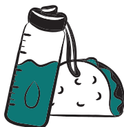
EAU, EN-CAS ÉNERGETIQUES, PIQUE-NIQUE