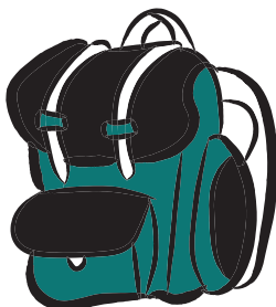
SAC ADAPTÉ À LA DURÉE DE LA RANDONNÉE