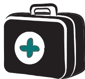
TROUSSE DE SECOURS, COUVERTURE DE SURVIE, PANSEMENTS, DÉSINFESTANT, MÉDICAMENTS, BANDAGES...