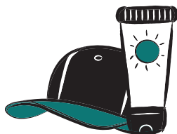
PROTECTIONS SOLAIRES, CRÈME, CASQUETTE, LUNETTES