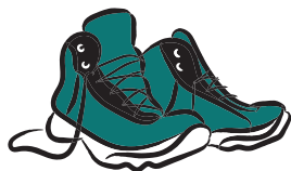
CHAUSSURES ROBUSTES ET CONFORTABLES